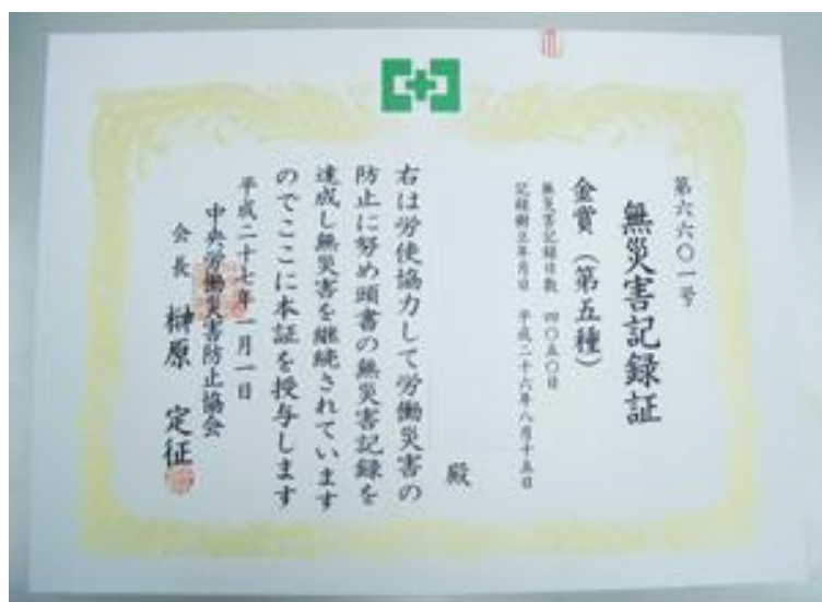
無災害記録証表彰状