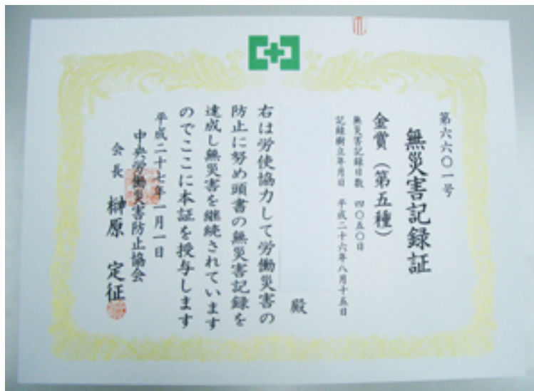
無災害記録証表彰状